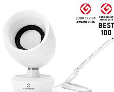
型式：comuoon SE Type BP